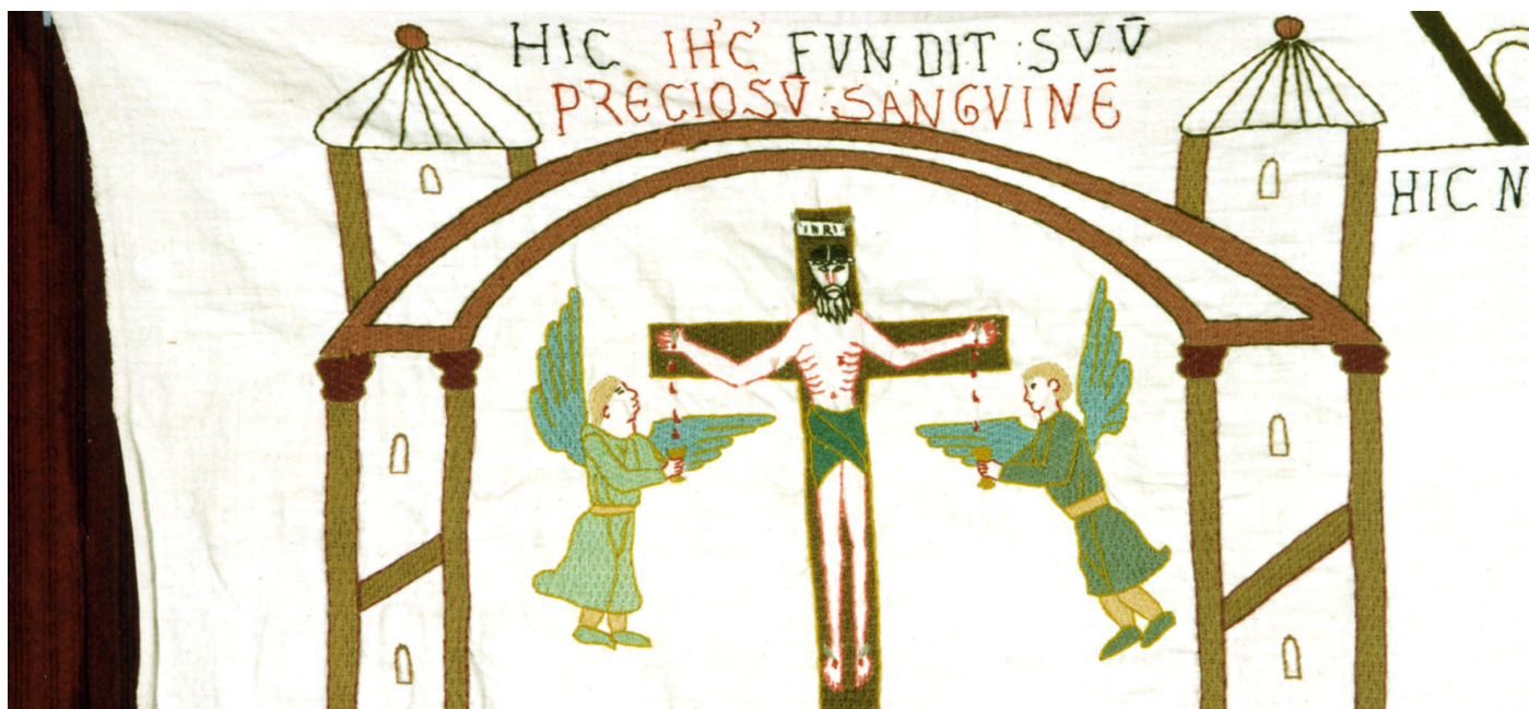
Détail de la broderie du Précieux-Sang, Fécamp.

Le reliquaire du Précieux-Sang, objet de culte conservé en l'abbatiale de Fécamp, est de retour ce mercredi 13 septembre 2023. Il avait été dérobé le 2 juin 2022 avec plusieurs autres objets de culte, retrouvés aux Pays-Bas un mois plus tard. Cette affaire avait suscité beaucoup d'émotion, notamment dans la communauté chrétienne. La remise du reliquaire à la Ville de Fécamp, son propriétaire, est accompagnée d'une messe en l'abbatiale, célébrée par Mgr Jean-Luc Brunin, évêque du Havre.