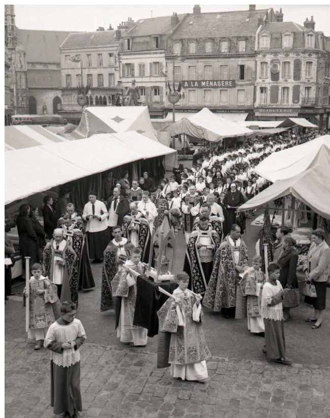
Procession du Précieux-Sang, années 1950, AMF Fonds Bergoin, Fécamp.

Le reliquaire actuel qui conserve deux fioles métalliques est haut d'environ 30 centimètres, en cuivre doré, et a été fabriqué au XIX e siècle.